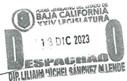
DIPUTADA LILIANA MICHEL SÁNCHEZ ALLENDE Presidenta de la Comisión de Igualdad de Género y Juventudes de la XXIV Legislatura del Congreso del Estado de Baja California