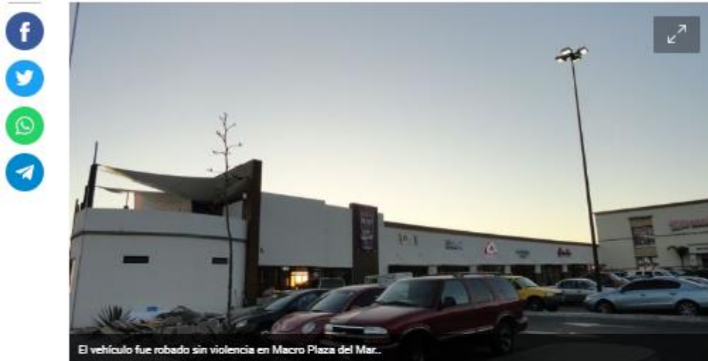
El vehículo fue robado sin violencia en Macro Plaza del Mar.