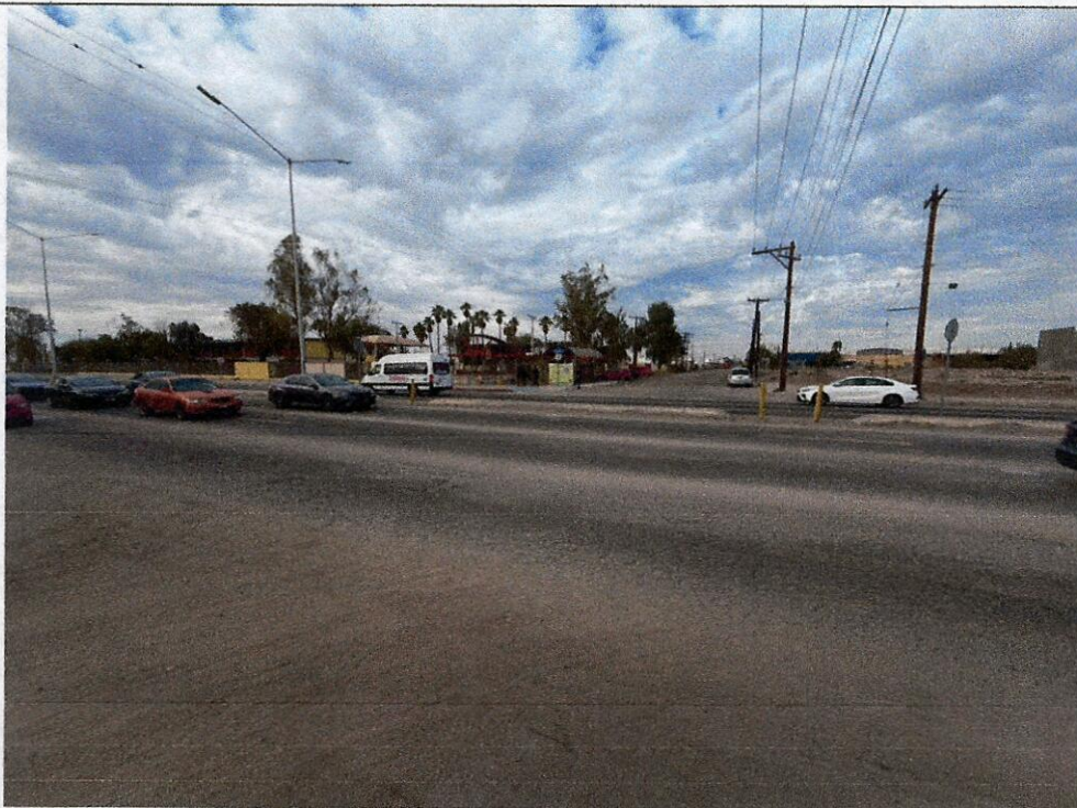
Imagen 1: Vista del CETYS 18 (al norte), sobre la calle Paraná (al sur). Se ve el transito del Boulevard Lázaro Cárdenas al sur de oeste a este y al norte de este a oeste.

En particular, la calle Río Paraná constituye un punto crítico de movilidad, al no contar con condiciones óptimas que garanticen trayectos seguros, lo que incrementa el riesgo de accidentes viales y situaciones de inseguridad, especialmente para mujeres, adolescentes, personas con discapacidad y población estudiantil.