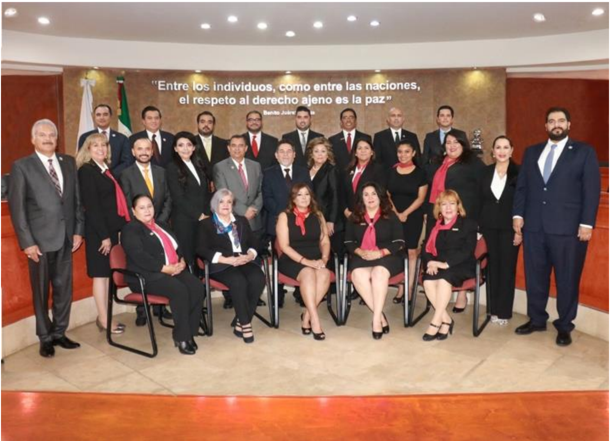
Foto oficial de las Diputadas y Diputados, que iniciaron la XXIII Legislatura Constitucional del Congreso del Estado de Baja California