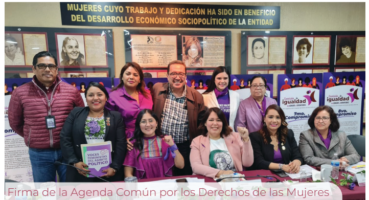
Firma de la Agenda Común por los Derechos de las Mujeres

en donde se atendieron acuerdos, exhortos y la dictaminación de diversas reformas.