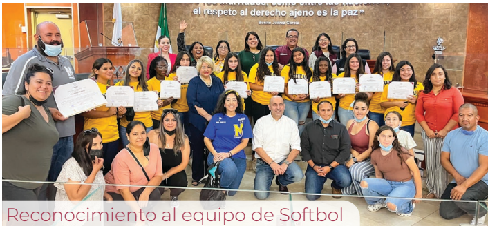
Reconocimiento al equipo de Softbol

Es por eso que este año promoví entre la comunidad de diputadas y diputados, con muy buena respuesta, el apoyar a un grupo de adolescentes que practican el softbol y que después de ganar un campeonato nacional, ocupaban recursos para sus uniformes, mismos que se usaron para regresar victoriosas de un campeonato mundial organizado en el estado de Texas, Estados Unidos.