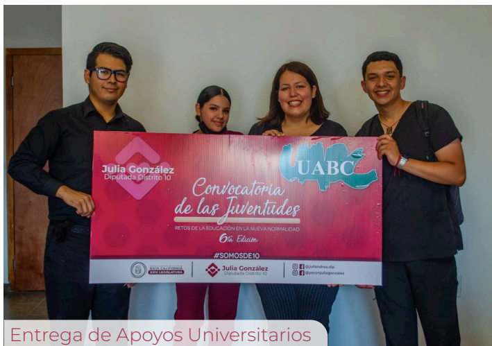
Entrega de Apoyos Universitarios

pues en muchos casos contaban con más de un hijo en edad escolar que resultó beneficiado.