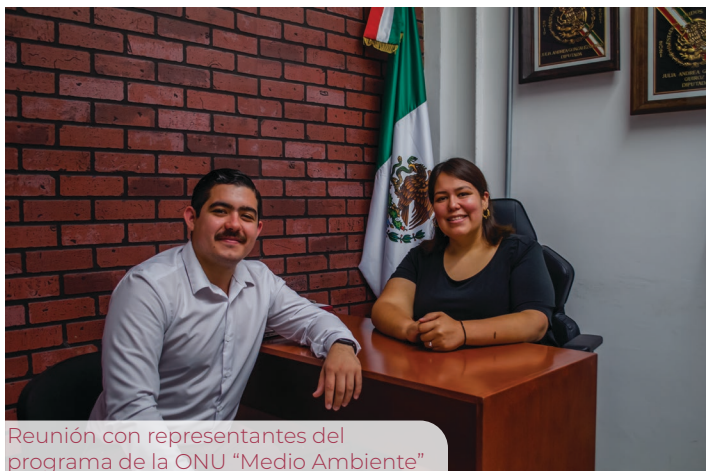
Reunión con representantes del programa de la ONU "Medio Ambiente"