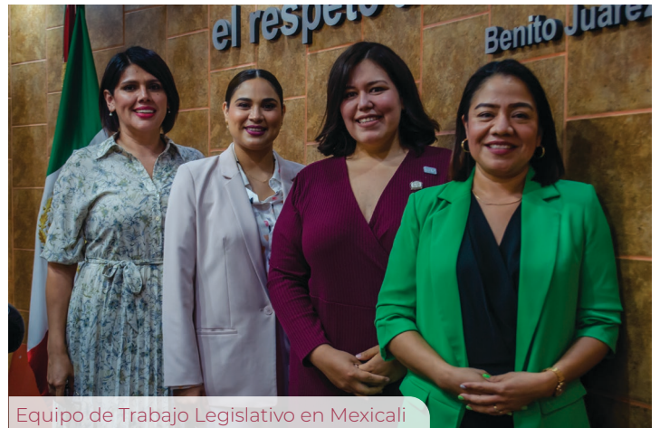
Equipo de Trabajo Legislativo en Mexicali

VI. Iniciativa de Reforma a la Ley para la Protección y Defensa de los Derechos de los Niños, Niñas y Adolescentes del Estado de Baja California , con la intención de garantizar la prohibición del trabajo en adolescentes mayores de 15 años cuando éste pueda perjudicar su salud, su educación o impedir su desarrollo físico o mental. También la prohibición del castigo corporal o humillante, siendo que las niñas, niños y adolescentes tienen derecho a recibir orientación, educación, cuidado y crianza de su madre, padre o de quienes ejerzan la patria potestad, tutela o guarda y custodia, así como de los encargados y el personal de instituciones educativas, deportivas, religiosas, de salud, de asistencia social y de cualquier otra índole.