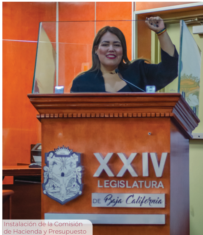
Instalación de la Comisión de Hacienda y Presupuesto