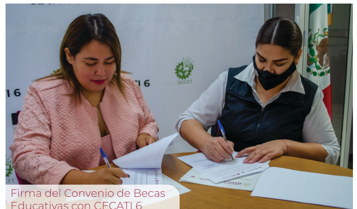
Firma del Convenio de Becas Educativas con CECATI 6