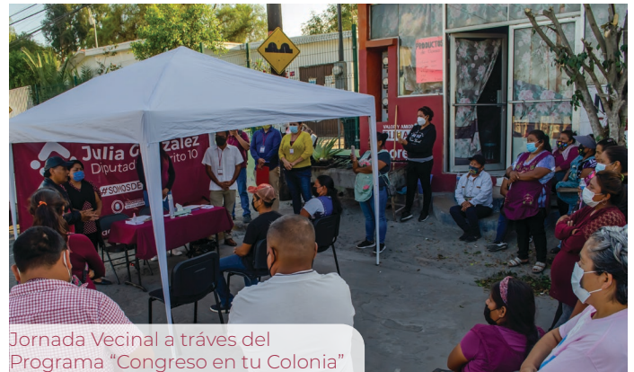
Jornada Vecinal a través del Programa "Congreso en tu Colonia"