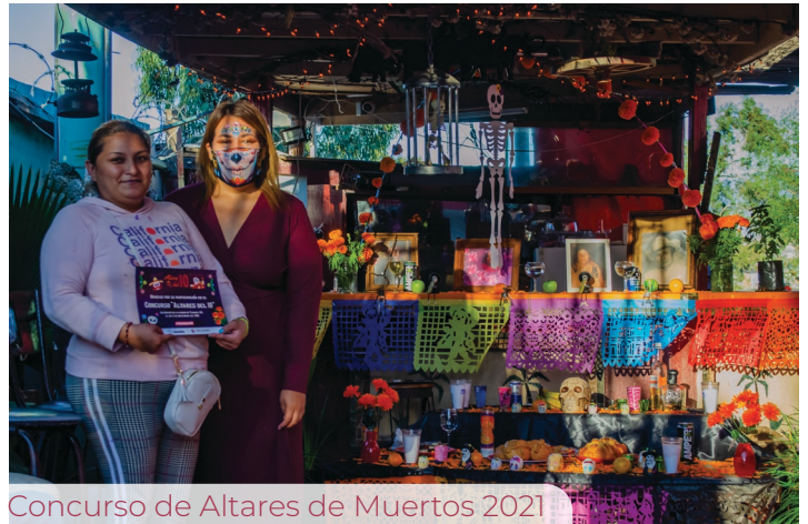
Concurso de Altares de Muertos 2021