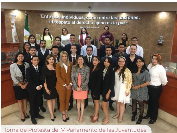
Toma de Protesta del V Parlamento de las Juventudes

nombramiento de miembros del Tribunal Superior de Justicia y a la designación del Fiscal General, además de aprobar diversas reformas de leyes y de carácter constitucional.