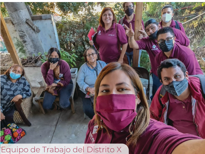
Equipo de Trabajo del Distrito X