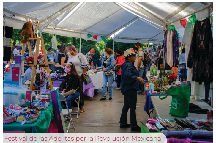
Festival de las Adelitas por la Revolución Mexicana