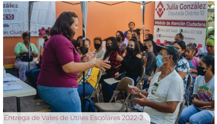
Entrega de Vales de Útiles Escolares 2022-23