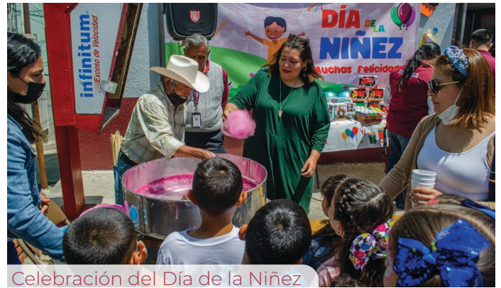
Celebración del Día de la Niñez