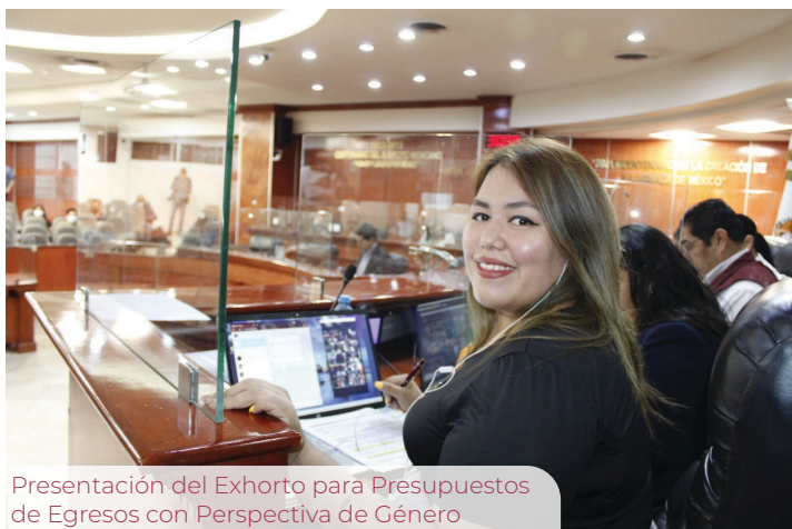
Presentación del Exhorto para Presupuestos de Egresos con Perspectiva de Género

Se ha presentado ante el Congreso un Proyecto de Acuerdo Económico en donde se exhorta a las autoridades estatales y municipales involucradas en los procesos de entrega y recepción, así como aquellas personas que han resultado electas para ocupar la gubernatura y presidencias municipales, en el próximo período constitucional, para que en la planeación de los Proyectos de Presupuestos de Egresos 2022, se aplique el principio de perspectiva de género en favor de las mujeres y de los grupos vulnerables , puesto que la pandemia provocada por el Covid-19 nos ha llevado al estancamiento en los esfuerzos para alcanzar la igualdad de género global, teniendo sin duda un impacto muy negativo para las mujeres ante las labores del hogar y el cuidado de adultos mayores y niños, incluso los procesos educativos, lo que ha aumentado sus niveles de estrés y reducido su productividad.