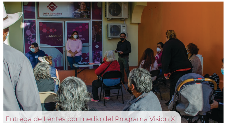
Entrega de Lentes por medio del Programa Vision X

En cuanto a la atención a sectores vulnerables, se brindaron diversos apoyos a personas con discapacidad, como sillas de ruedas y medicamentos, incluyendo la reparación de sistemas de refrigeración en un Centro de Atención Múltiple Laboral,