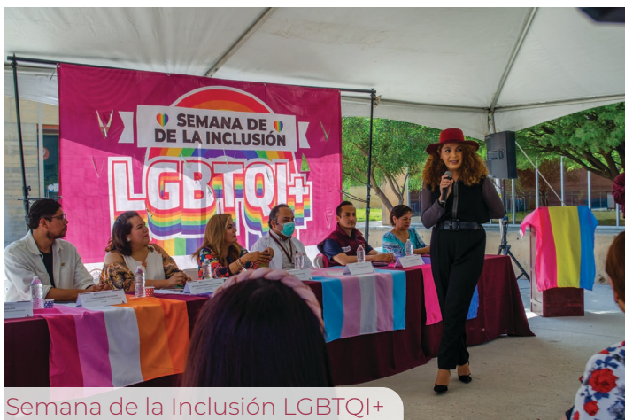
Semana de la Inclusión LGBTQI+