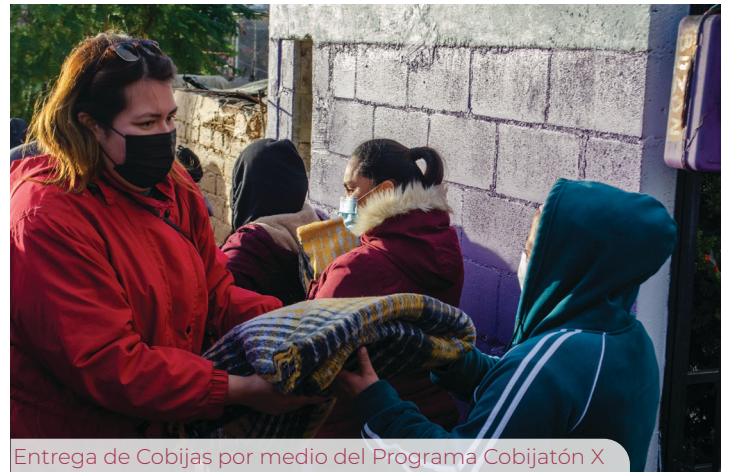
Entrega de Cobijas por medio del Programa Cobijatón X

Además, buscando mejorar la calidad de vida de las vecinas y vecinos del Distrito X, se brindaron apoyos en medicamentos, lentes, mamografías, servicios dentales, análisis clínicos y en la compra de sillas de ruedas, beneficiando así a