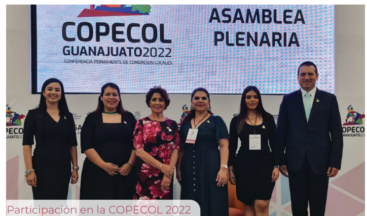
Participación en la COPECOL 2022