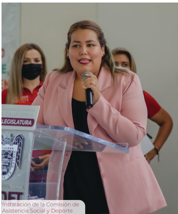
Instalación de la Comisión de Asistencia Social y Deporte

IX. Iniciativa de Reforma a Diversas Proposiciones de la Ley Orgánica del Estado de Baja California , con la intención de actualizar la denominación de la Auditoría Superior del Estado de Baja California , que no había sido armonizada con la Ley de Fiscalización y Rendición de Cuentas del Estado de Baja California, lo cual podría generar diversas implicaciones legales y administrativas importantes, por contravenir a esta última Ley mencionada.