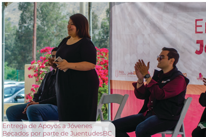
Entrega de Apoyos a Jóvenes Becados por parte de JuentudesBC