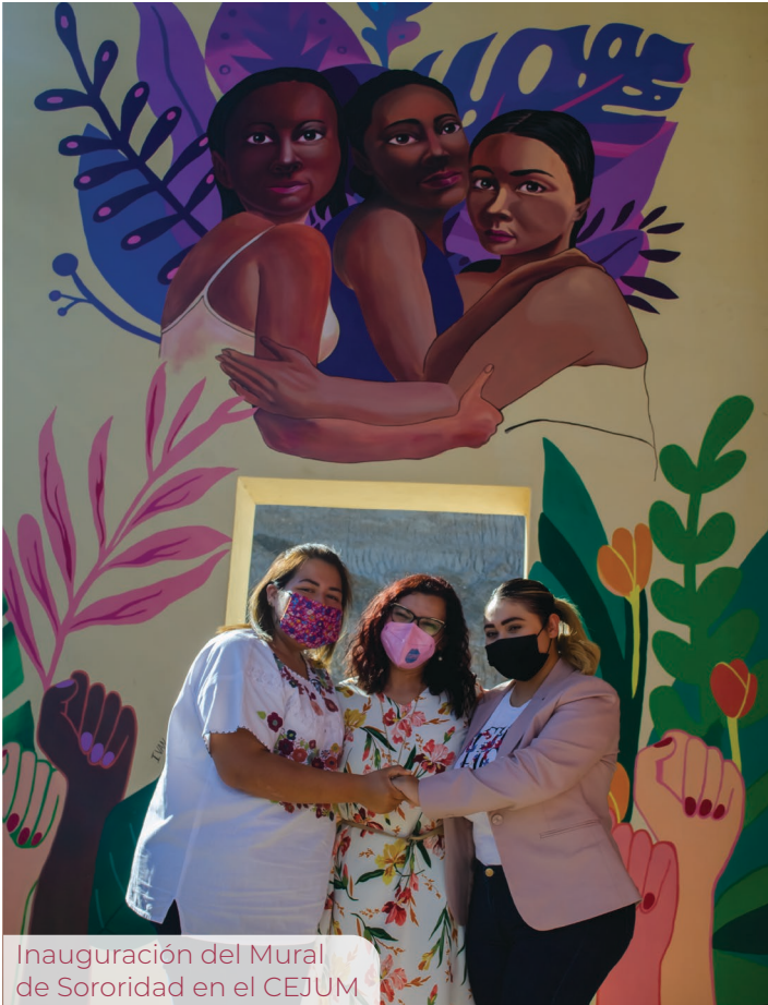
Inauguración del Mural de Sororidad en el CEJUM