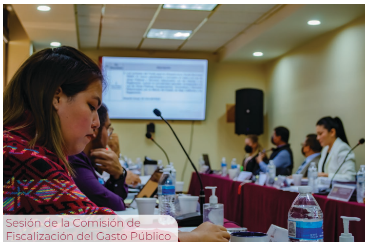
Sesión de la Comisión de Fiscalización del Gasto Público

Al respecto de las distintas iniciativas presentadas a lo largo de este año, considero importante reafirmar mi compromiso con las juventudes, las niñas y mujeres, las personas con discapacidad y la comunidad LGBTQI+ . De igual forma, con base en la Alerta por Violencia de Género en contra de las Mujeres en nuestro Estado, me he dado a la tarea, no sólo de presentar algunas reformas si no de darle seguimiento puntual a las labores encabezadas por la presidencia de la Comisión de Igualdad de Género y Juventudes.