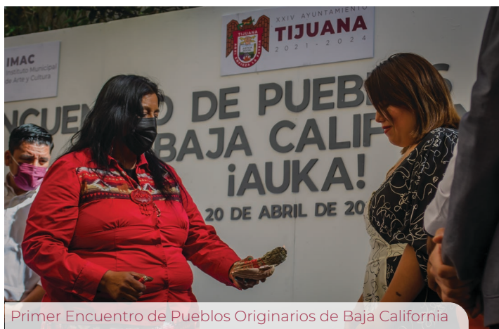
Primer Encuentro de Pueblos Originarios de Baja California