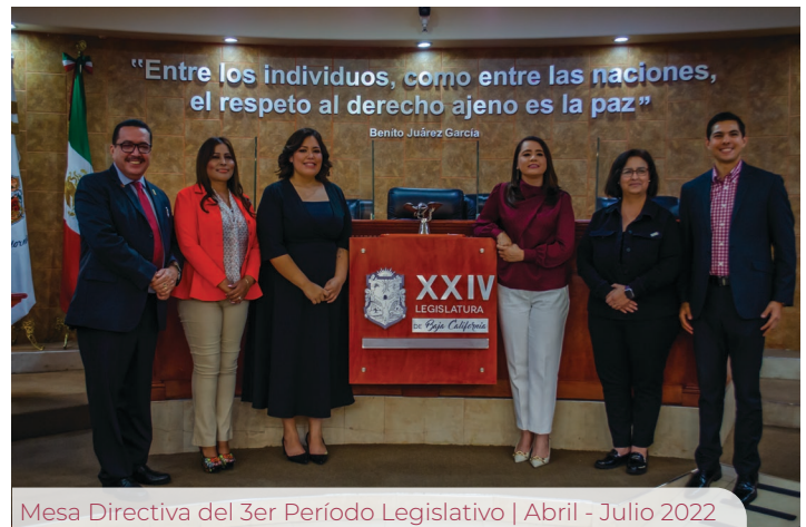
Mesa Directiva del 3er Período Legislativo | Abril - Julio 2022

Durante el período, nos basamos en una política de apertura, turnando más de 100 iniciativas o puntos de acuerdo , a las comisiones especializadas en cada tema, con la intención de promover la participación de todas y todos los diputados en la actividad legislativa. Entre las actividades que se han realizado están: